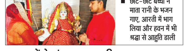
छोटे-छोटे बच्चों ने माता रानी के भजन गाए, आरती में भाग लिया और हवन में भी श्रद्धा से आहुति डाली

चैत्र नवरात्रों के दूसरे दिन कोंट रोड मिनी बाईपास, काली माता मंदिर रोड स्थित दक्षिण काली नवदुर्गा मंदिर में मां दुर्गा के ब्रह्मचारिणी स्वरूप की विधि-विधान से पूजा-अर्चना की गई।