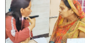
बीपीएमएस के 37वें निःशुल्क शिविर में आंखों की जांच इंदिरा गांधी आई हॉस्पिटल एंड रिसर्च सेंटर गुरुग्राम के वरिष्ठ चिकित्सकों व मेडिकल एवं कैसर जांच दिल्ली के राजीव गांधी कैसर इंस्टीट्यूट के अनुभवी डॉक्टरों ने की। बीपीएमएस के 36वें निःशुल्क शिविर में 125 मरीजों की ओपीडी जांच हुई थी। पिछले माह के शिविर की उल्लेखनीय विशेषता यह रही थी कि बीपीएमएस के 35वें शिविर में नेत्र ऑपरेशन करवाने वाले दो मरीजों से 36वें शिविर का शुभारंभ करवाया गया था।

बीपीएमएस के 37वें निःशुल्क शिविर में भारी संख्या में मरीजों की जांच