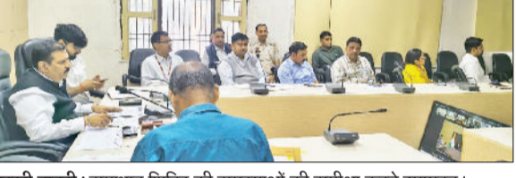
चरखी दादरी। समाधान शिविर की समस्याओं की समीक्षा करते उपायुक्त।

जिले में समाधान शिविर की शिकायतों के निवारण के लिए लगातार कार्य किया जा रहा है। प्रशासन की कोशिश रहती है कि समस्याओं का समाधान किया जाए। उपायुक्त डॉ. मुनीश नागपाल ने जिला के सभी अधिकारियों को प्राथमिकता के आधार पर कार्यवाही के निर्देश दिए हैं। मुख्यमंत्री नायब सिंह सैनी के आदेशानुसार प्रदेशभर में आयोजित किए जा रहे समाधान शिविर में जिला व उपमंडल स्तर बेहतर तरीके से कार्य किया जा रहा है। सोमवार और वीरवार को आयोजित होने वाले शिविरों में आई समस्याओं की प्रत्येक शुरुवात को समीक्षा की जाती है।