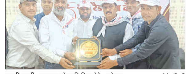
चरखी दादरी। उपायुक्त को स्मृति चिन्ह देते आयोजक।