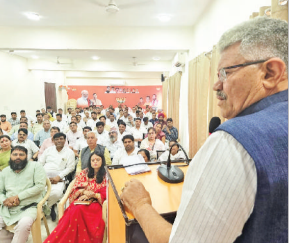
भिवानी। लोगों को संबोधित करते हुए।

सरकार की जनकल्याणकारी योजनाओं का लाभ समाज के अंतिम व्यक्ति तक पहुंचाना कार्यकर्ताओं की जिम्मेदारी